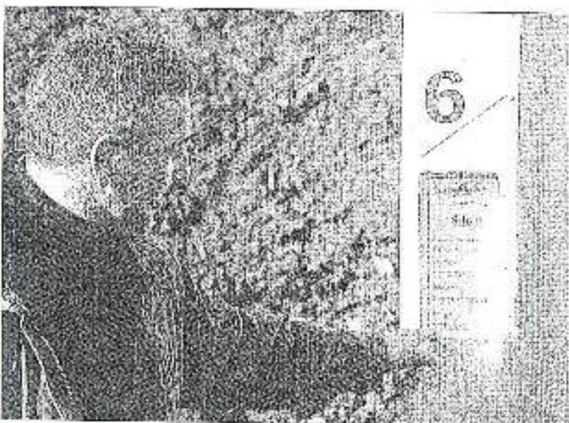
Chaque case comporte un numéro de lot pour assurer la traçabilité.